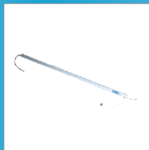
RIP6002 Lampada led luce pulizia abitacolo 14W