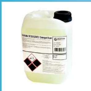
RIP1484 Schiuma detergente