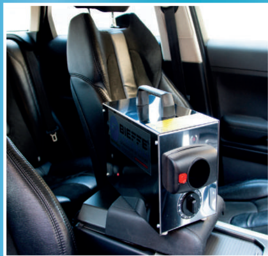
BF360 Generatore di ozono per la sanificazione di piccoli/medi ambienti